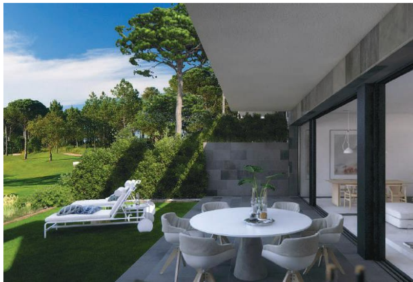
Computer generierte Bilder nur zu illustrativen Zwecken.