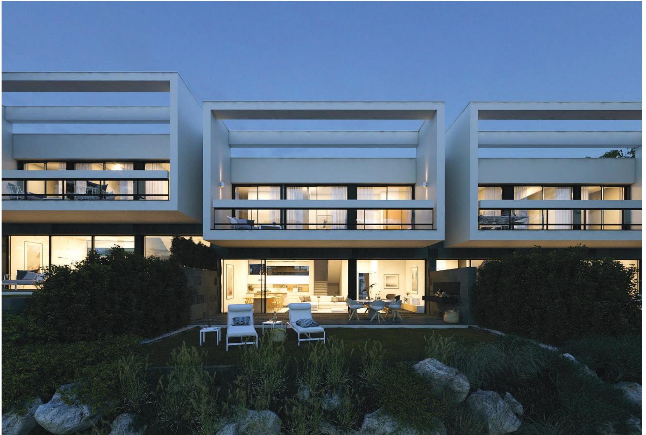
Computer generierte Bilder nur zu illustrativen Zwecken.